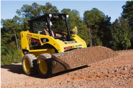
Kompaktlader CAT 226B (0,36 cbm) von Caterpillar