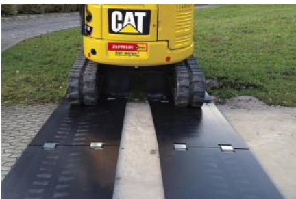
Fahrplatten 2000 x 1000 x 15 mm von LuxTek