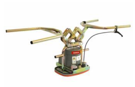
Vakuumhebergerät SPEEDY VS-S, Nutzlast max. 140 kg von Probst