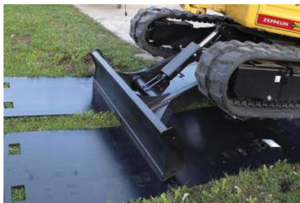
Fahrplatten 2000 x 1000 x 20 mm von LuxTek