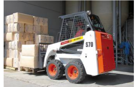
Kompaktlader Bobcat S 70 (0,18 cbm) von Bobcat