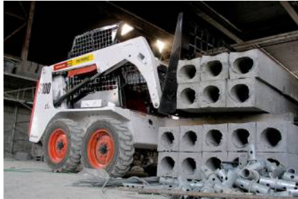
Kompaktlader Bobcat S 100 (0,23 cbm) von Bobcat