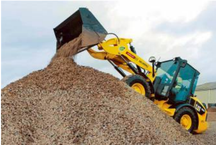
Radlader CAT 906H2 (0,9 m 3 ) von Caterpillar