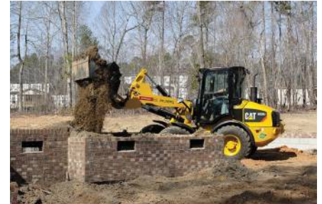
Radlader CAT 908H2 (1,1 m 3 ) von Caterpillar