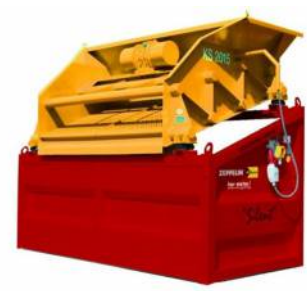
Siebmaschine KS2015 Silent