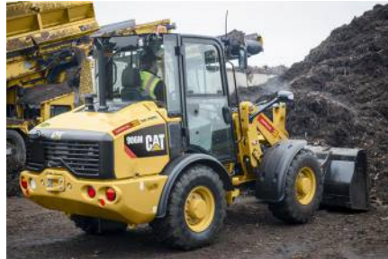
Radlader CAT 906M (0,9 m 3 ) von Caterpillar